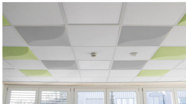
Faux plafond: soni COMFORT SD et soni COLOR DESIGN YIN YANG